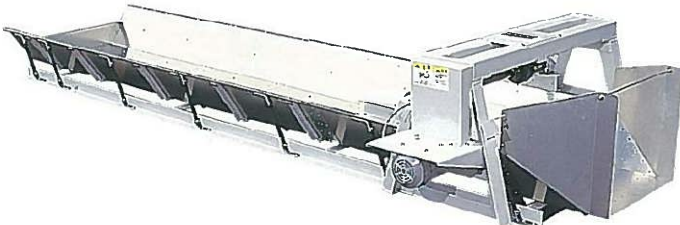
揉捻機・中揉機トラフコンベア