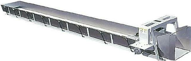
粗揉機トラフコンベア