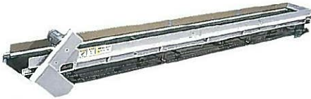
蒸葉中間コンベア