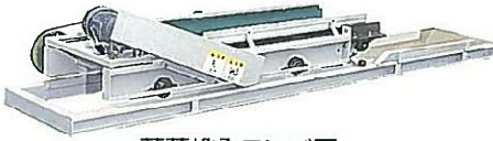
蒸葉投入コンベア