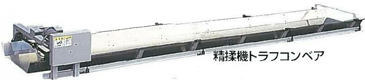
精揉機トラフコンベア